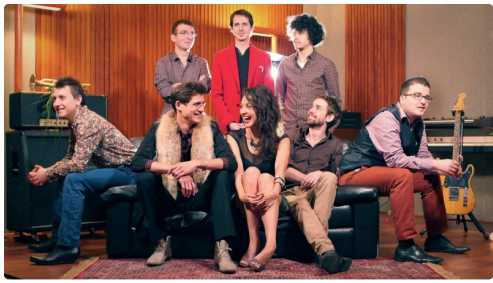
Sugar Bones