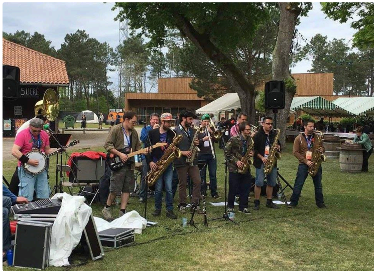
Le Cri'art révèle son programme pour la Fête de la Musique 2019

Vendredi 21 juin à partir de 19 h, la Fête de la Musique se déroule au jardin Ortholan, en cas de pluie, repli au Cri'Art