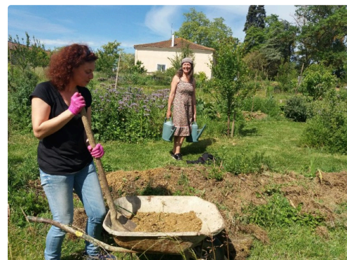
Les bénévoles ne comptent pas les heures et s'activent régulièrement au jardin.