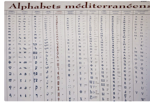
Extrait du tableau "Alphabets méditerranéens" de l'association Alphabets (Nice)