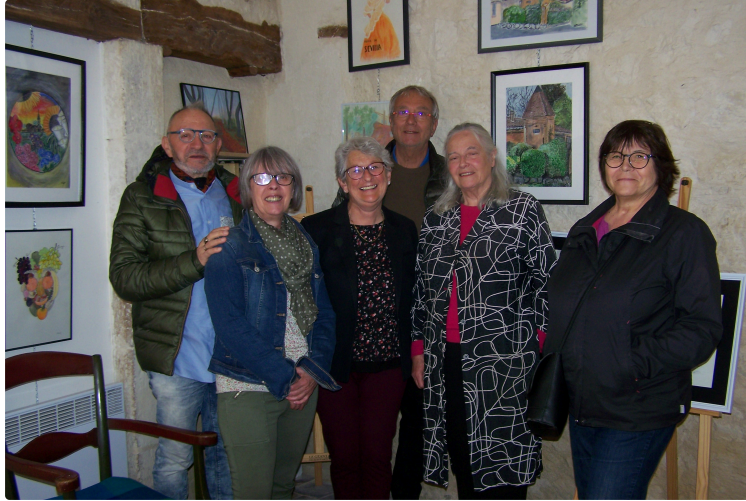
Vernissage des élèves de l'atelier de Guy Coanus, artiste peintre