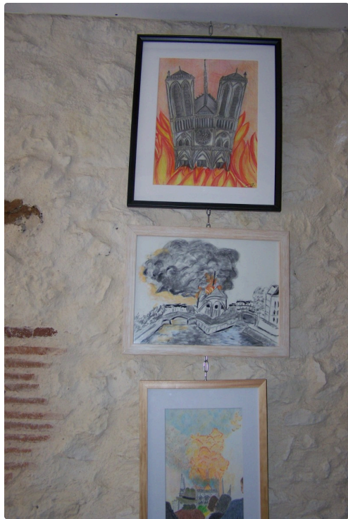
Un sujet poignant d'actualité "Notre-Dame de Paris"