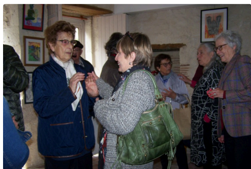
Quelques invités lors du vernissage