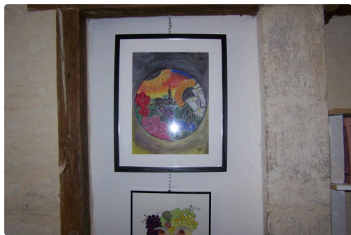
Une idée inspirée de Guiseppe Arcimboldo par Claude Galey