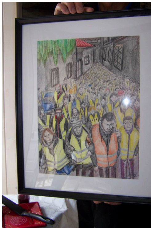
Les gilets jaunes