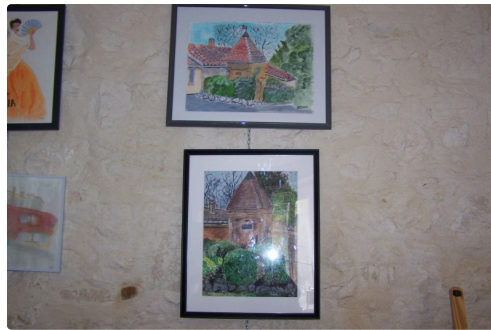
Les pigeonniers de notre jolie région