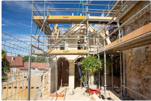
Le pigeonnier sur la terrasse opposée à la RD6 (rue principale)