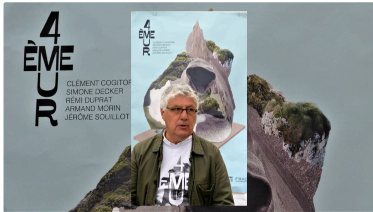
memento saison 4 : 4ème mur

" MEMENTO est un lieu singulier où se conjuguent les traces du passé et la création contemporaine. Cet ancien carmel, devenu archives départementales, se mue au fil des ans pour offrir aux visiteurs une expérience unique de découverte d'œuvres d'art au cœur d'une bâtisse hors du temps. Depuis trois ans maintenant cet écrin patrimonial devient, durant l'été, un terrain d'imagination et de création pour les artistes de la scène actuelle. Tout est parti d'une volonté de vivre l'exposition comme une aventure intime entre le lieu, les artistes et le public. Ce que nous voulons avant tout c'est défendre un endroit où les émotions des pratiques artistiques résonnent."