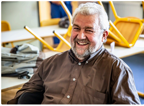
Belmir Dos-Reis - Photos DR