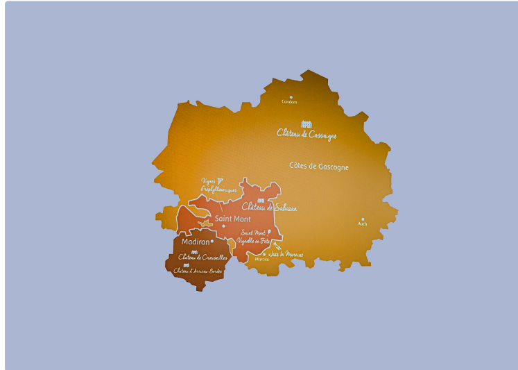
Plaimont s'engage résolument dans l'œnotourisme

Avec une offre de visites bien construites et de qualité