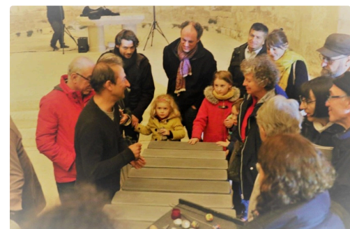
Le public intrigué par ces drôles d'instruments