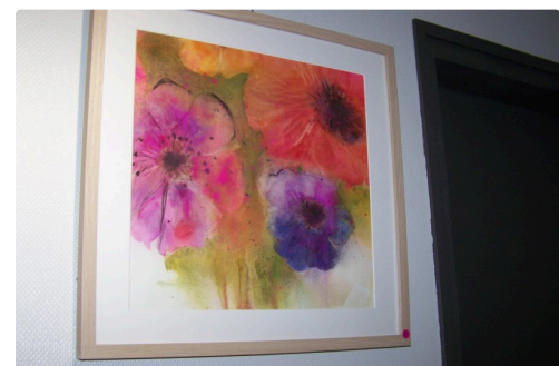
" Esprit de fleurs" de Françoise Nogué