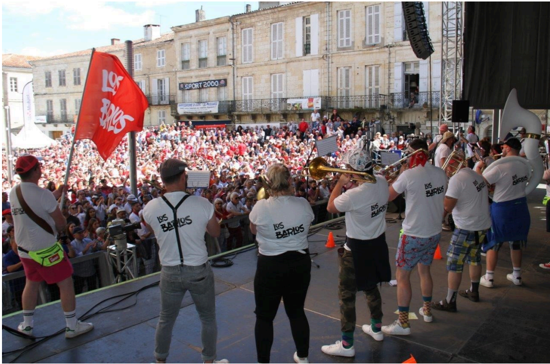
Argent pour Los Barlos