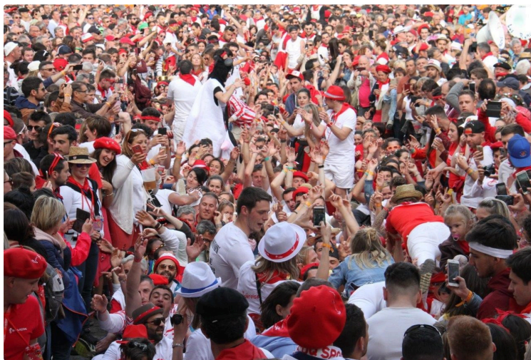
Les Bandas comme si vous y étiez !

Marc Le Saux, notre photographe, était au milieu de la foule, pour sa plus grande joie, et a pu saisir tous les moments importants qui ont jalonné ces trois journées du Festival de Bandas 2019, derrière son objectif.