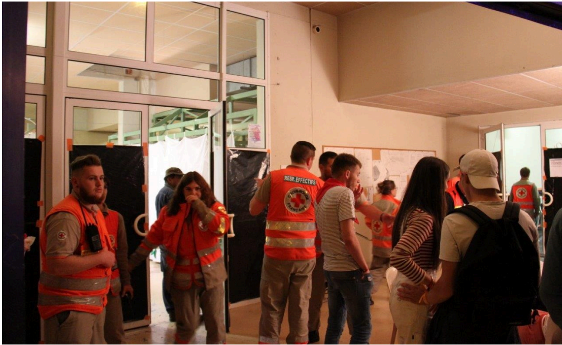
Merci à ceux qui ont veillé sur les petits soucis