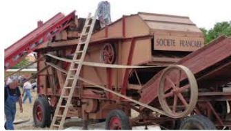
Randonnée de la GV du mardi 14 mai dans le secteur de Cadignan