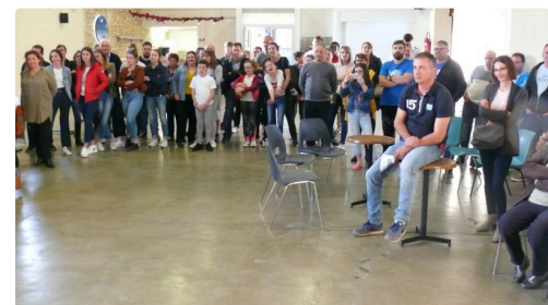
Les supporters étaient venus nombreux.