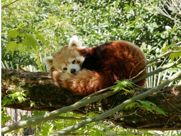
Le Parc animalier des Pyrénées célèbre ses 20 ans !