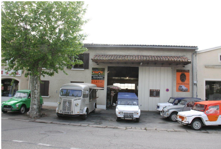
Du nouveau pour les véhicules anciens.

Samedi dernier 27 avril, l'équipage de la SAS Classic Bouquerie - L'Atelier Vintage, inaugurerait son magasin de vente de pièces détachées de 2CV et de ses dérivés (Méhari, Ami 6 et 8, Dyane, Acadiane...).