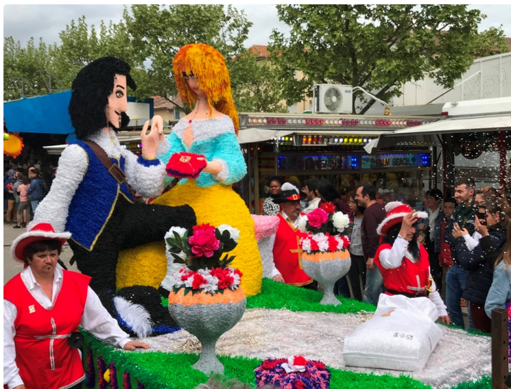
Retour en images sur le 30ème carnaval

Où pouvait-on croiser ce week-end une cigale et une fourmi, de belles Sévillanes, un bateau de pirates, les trois mousquetaires, un château fort, des majorettes, une reine entourée de ses dauphines ?... Au carnaval de Fleurance, qui fêtait cette année ses trente ans d'existence.