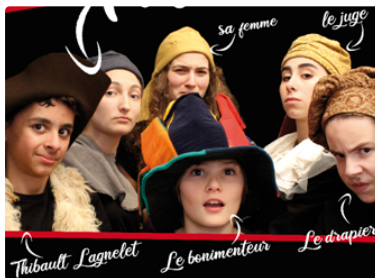
La Boîte à Jouer part en balade

En attendant le prochain festival, cet été