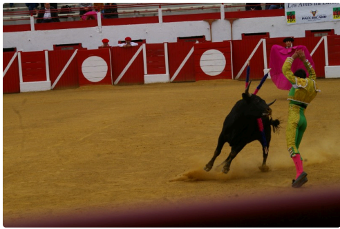
Solalito aux banderilles