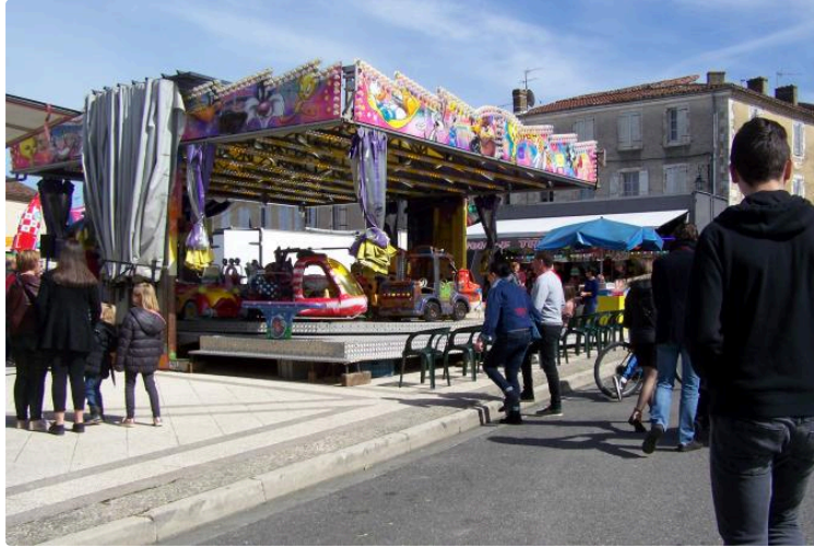
Un week-end au rythme de la Festi-Foire