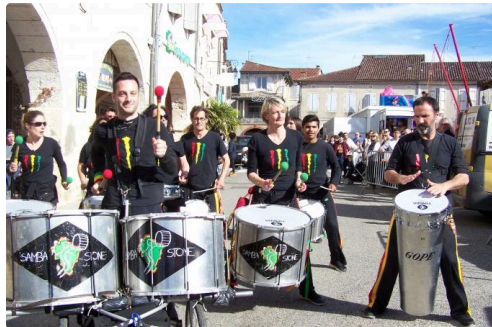
Mauvezin Avril 2018 Bis.JPG