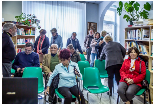
4 Le public s'installe 1bis 060419.jpg