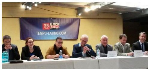
On garde le sourire

Retrouvez la présentation du festival Tempo Latino ici