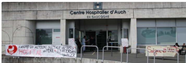
Préavis de grève illimité pour le service d'orthopédie/traumatologie élargi à l'ensemble des agents

L'équipe paramédicale AS et IDE (Aide soignant/infirmier) du service chirurgie orthopédique et traumatologique (1B) du Centre Hospitalier d'Auch, s'est mise en grève depuis jeudi 00 h. En souffrance depuis plusieurs années du fait d'un effectif insuffisant au regard de la charge de travail qui leur incombe.