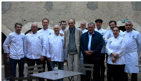
Les gagnants du concours entourés des chefs