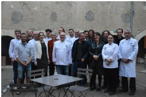
Photo de famille 2019