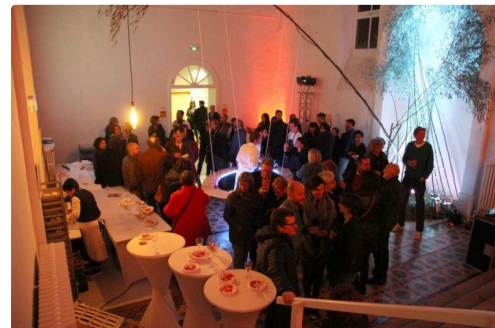
La grande salle des desserts