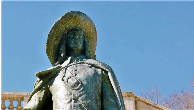
D'Artagnan, le héros de nos campagnes

Le nom de d'Artagnan résonne aux quatre coins du monde et continue aujourd'hui encore de faire rêver des générations entières. Ce que certains ignorent, c'est que le plus célèbre des mousquetaires a réellement existé, avant de devenir une légende de la littérature de cape et d'épée. Légende vivement entretenue par le petit village de Lupiac, au cœur du Gers, où il naquit.