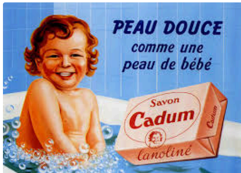
pub antan 3.jpg

L'exposition est visible du 15 septembre au 15 décembre 2015 aux Archives départementales du Gers les Lundis, mercredis et vendredi de 9 heures à 17 heures et chaque mardi de 13 à 17heures - Parc départemental du Gers 81 route de Pessan à Auch