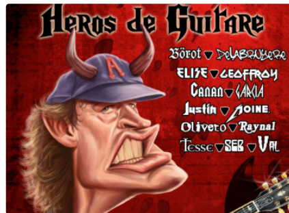
Salon de la Caricature et du Dessin de Presse

Aussitôt la Baguenaude terminée, où le sport a connu un beau succès avec plus de deux cents participants par une magnifique journée, CLAP prépare son activité culturelle par excellence : le Salon de la caricature et du Dessin de Presse qui va connaître sa 17ème édition du 7 au 10 juin, aux Granges de la Mairie. Sous la dénomination « Héros de la Guitare », elle sera présidée par Ganan, un fort sympathique et talentueux dessinateur, qui a déjà participé les années précédentes à la manifestation. Le titre colle bien avec l'activité musicale débordante que connaît Marciac, la cité du jazz en juillet et août. Treize dessinateurs qui connaissent déjà une belle notoriété seront présents à savoir Börot, Delabruyère, Elise, Geoffroy, Canan, Garcia, Justin, Moine, Oliveto, Reynal, Tesse, Seb et Val. Une belle affiche.