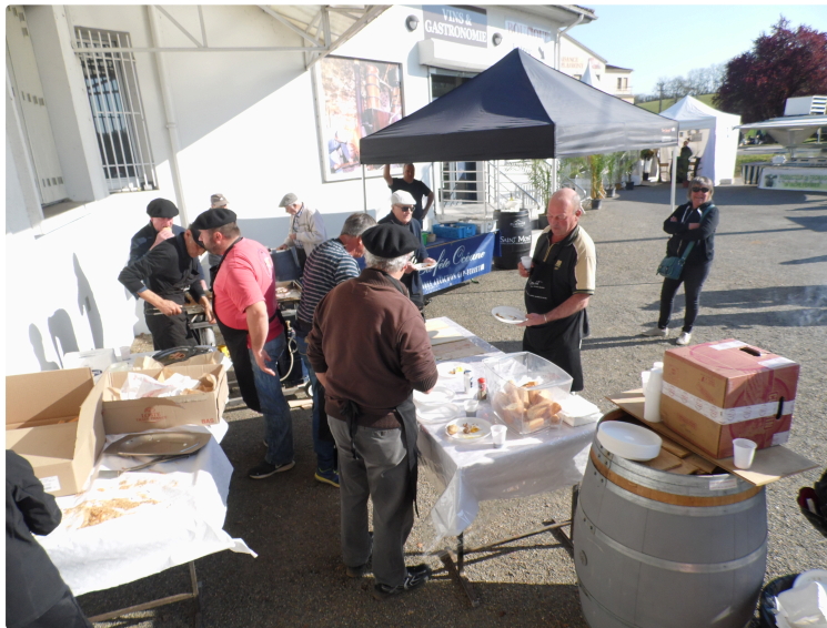
Saint Mont vignoble en fête

Après la journée pédagogique du vendredi, suivie par de nombreux étudiants, samedi et dimanche étaient moins studieux, plus pour goûter au plaisir festif.