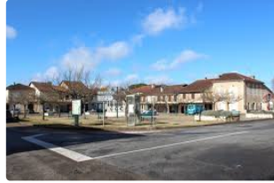
Randonnée autour de Lannepax

Le territoire de Lannepax était fortement garni de forêts, landes, arbres, végétation diverse.