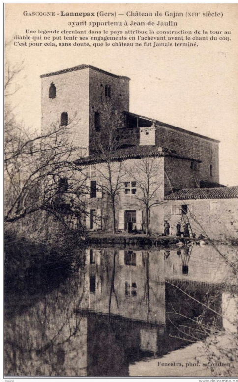
Le Château de Gajan