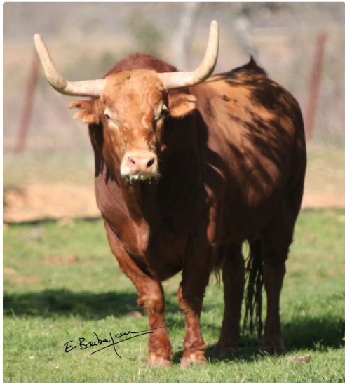
Pedraza de Yeltes