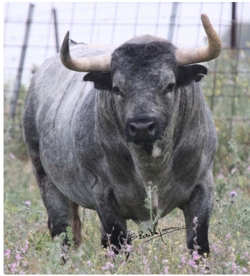
Partido de Resina