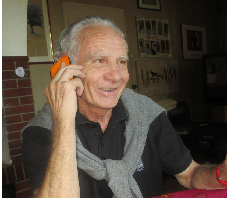
Tableau des toros de la feria 2019