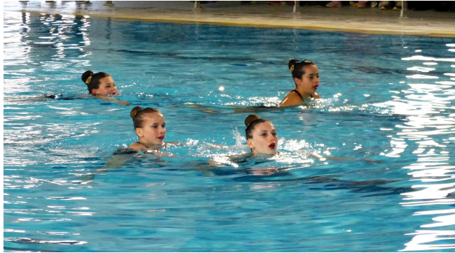
Démonstration de natation synchronisée.