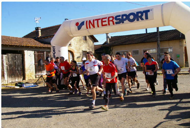
Trail Départemental des sapeurs-pompiers

Trente-cinq concurrentes et concurrents à travers bois vignes et chemins