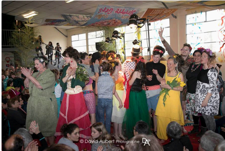
Un défilé qui n'a rien à envier à ceux de la capitale

Si vous aviez eu l'occasion d'écouter Radio Coteaux [1], la radio gersoise de Saint-Blancard, ce lundi matin 11 mars, entre 11 h et 12 h, cet article n'aurait plus aucun intérêt pour vous. Vous sauriez tout de ce qui va se passer à Simorre [2], dimanche prochain, le 17 mars.