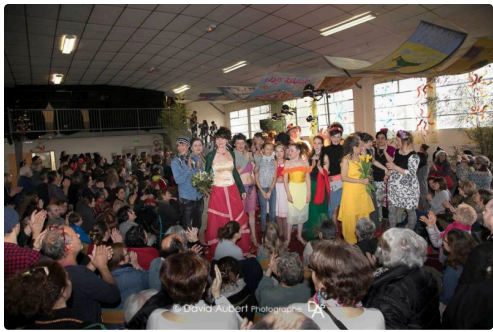
Le défilé édition 2018 avec une assistance visiblement enchantée