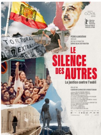
LE SILENCE DES AUTRES.JPG