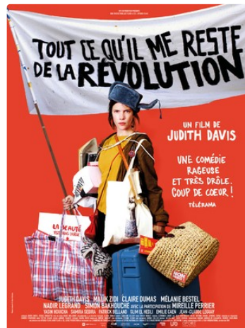
TOUT CE QU IL ME RESTE DE LA REVOLUTION.JPG