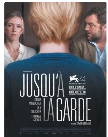
JUSQU A LA GARDE.JPG