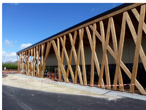
L'entrée principale du nouveau casino : somptueuse !

Bibliographie : Chambre régionale des comptes 12 juin 2018