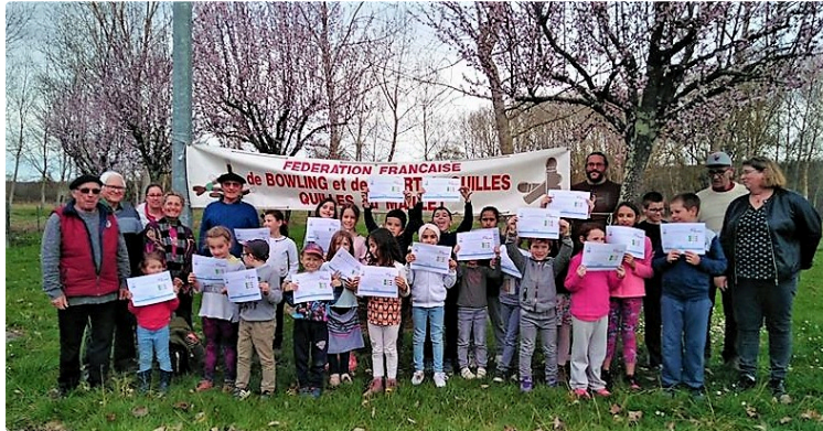
Les quilles au maillet séduisent les plus jeunes

Le mercredi 6 mars, entre soleil et nuages, les centres de Loisirs Val de Gers de Masseube, Pavie et Seissan sont venus à Sansan pour une initiation organisée par le foyer rural d'Orbessan et le Comité département de Quilles au Maillet du Gers.