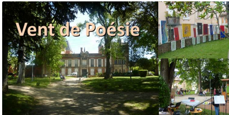
Vent de poésie

Les 16 et 17 mars, au Parc de la Marquise