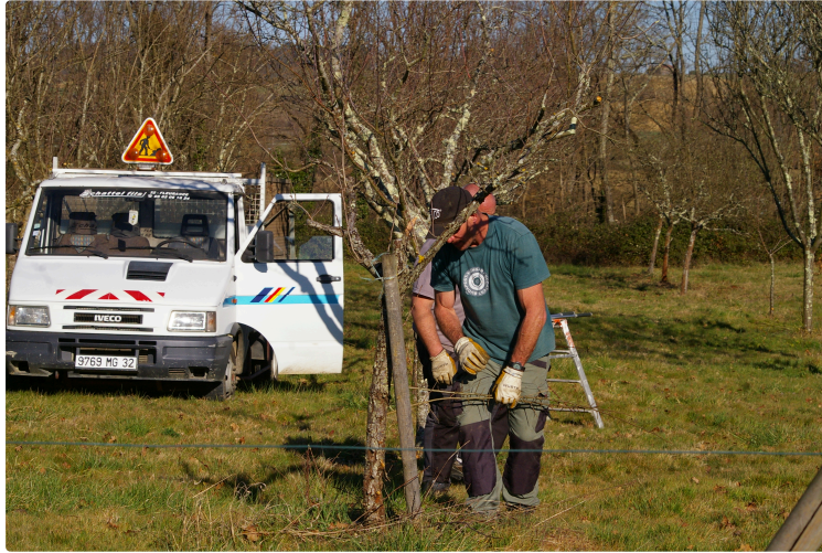
Des travaux de taille au verger des "Hespérides"

"Taille tôt, taille tard, rien ne vaut la taille de mars"