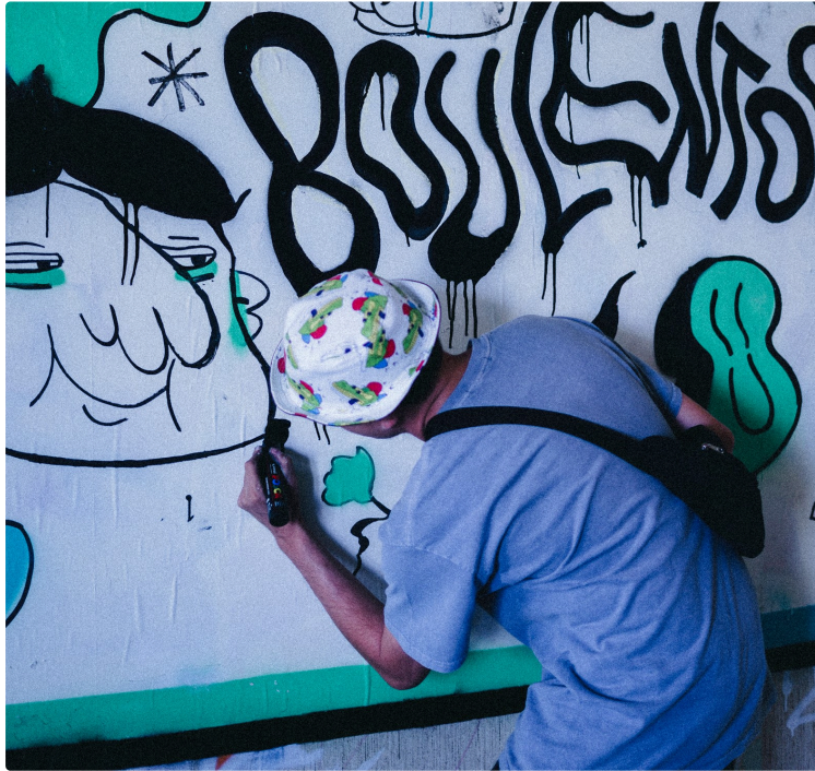
La fourmière envahit Save The Arts Gallery

Une exposition aussi hybride que jubilatoire