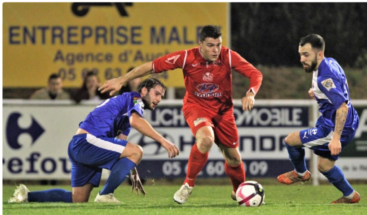
Football : Auch confirme sa suprématie face à Fleurance

Un derby qui a permis aux Auscitains de se remettre en confiance, Fleurance par contre continue à douter