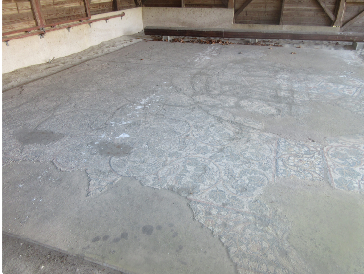
Un patrimoine en danger

La mosaïque à décor de pampres de Valence-sur-Baïse (Gers) a été découverte, entre les lieux-dits Le Miam et La Grange du Mian, dans un champ qui porte le toponyme de Gleiza, à l'extrémité occidentale du territoire communal, près des limites avec les communes de Mansencôme, Mouchan et Lagardère. Elle ornait une villa rurale qui occupait un léger mamelon (altitude 150 mètres) ; abrité du vent du nord par le plateau du Miam (altitude 19 mètres), il descend en pente douce en direction du sud et de l'est, vers la petite vallée du ruisseau de Grézillon.