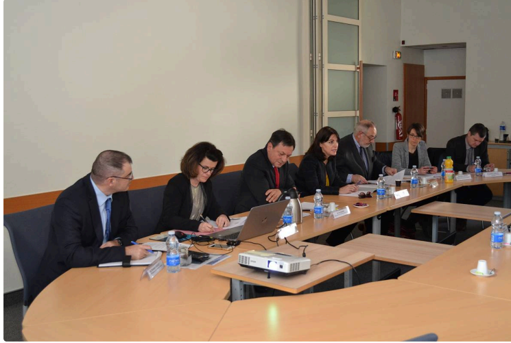
Commission de surendettement : bilan 2018