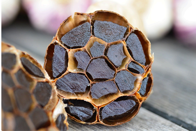
L'ail noir à l'eau de mer