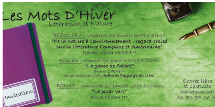
Les Mots d'Hiver : première conférence ce soir