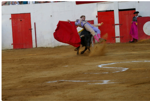
Retour sur juillet 2018 : Villalba découvre son premier Turkey