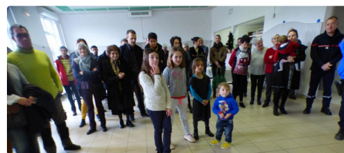
Une assistance nombreuse et jeune

Le conseil municipal met en œuvre une politique pour donner de la commune une image attirante, de manière à inciter de nouvelles populations à s'installer dans le village.