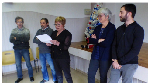
Le maire et son conseil municipal