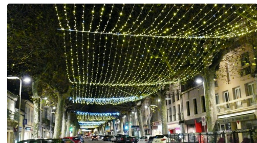
Plafond lumineux, avenue Alsace.