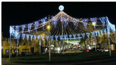
Le chapiteau place de Verdun.