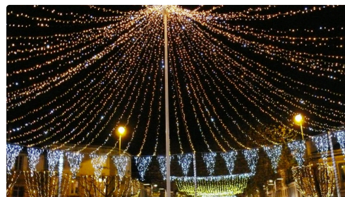
Un mat de 12 mètres de haut pour soutenir la structure.