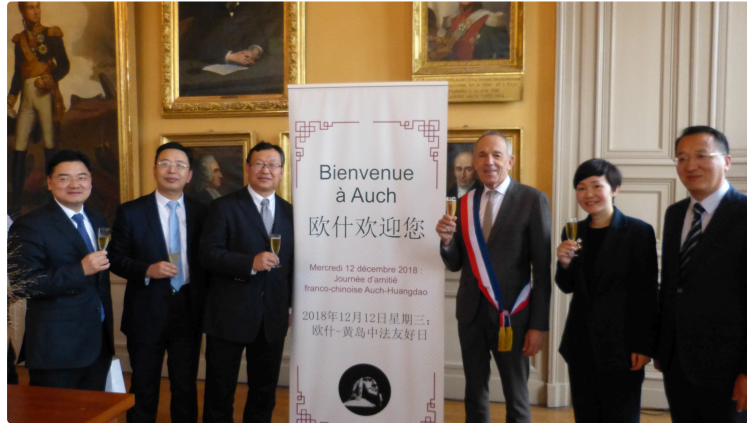
Auch et ses chinoiseries