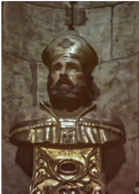
Buste reliquaire de Saint Austinde à la cathédrale d'Auch