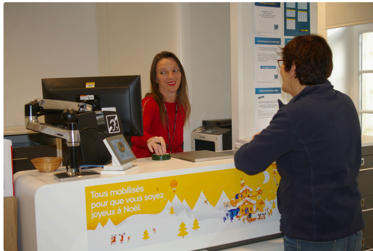
Le bureau de poste de Plaisance est ouvert à nouveau

Il était fermé pour rénovation pendant deux mois