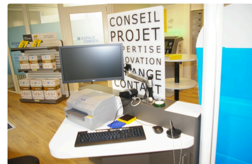
Un guichet conseil