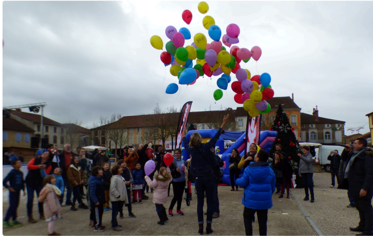
Joli succès du téléthon

Le Téléthon organisé place de l'Hôtel de Ville a connu cette année encore un joli succès.